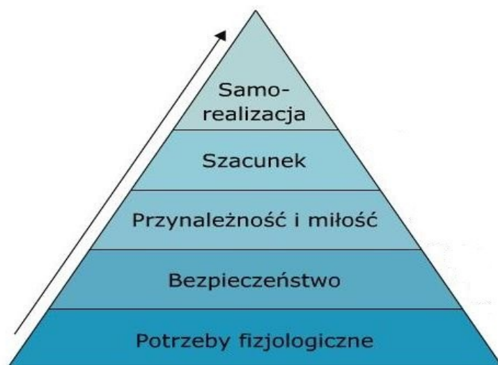
Rys. 1. Piramida potrzeb A. Maslowa

Człowiek pragnie czuć się bezpiecznie w każdej sytuacji. Tę tezę uwzględnił w badaniach słynny amerykański psycholog – Abraham Maslow, który w swojej teorii hierarchii potrzeb, umieścił potrzebę bezpieczeństwa na drugim miejscu, tuż po potrzebach fizjologicznych.